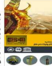
بغداد: الرسالة السياسية

شارعت مؤسسة آثار و تراث ذي قار باصدار دليل سياحي مطبوع يحتوي على امثلة للمواقع السياحية بمدينة اور الارية ومواقعها المختلفة مثل الزقورة والمعبرة المائية والمحكمة العليا بيت النبي ابراهيم (ع) وقيل مفتش آثار وتراث ذي قار طاهر كوين ان "المفتشية نشرت بطبع الفولدرات بساعدات كثيرة ستوزع على جميع الوافدين الى مدينة اور الارية ترافاً مع زيارة البابا لتعريف أكثر بصحة هذه المدينة التاريخية وتيسرة عن امكانها الارية" وأشار كوين الى الجهود المبذولة من قبل ادارة موقع اور الاري والتي كانت واضحة في طباعة هذه الفولدرات التي ستوزع على الوفود المرافقة لزيارة بابا الفاتيكان (فرانسيس) كنوع من التعريف بخضرة سومر في الناصرية وعنفها التاريخي.