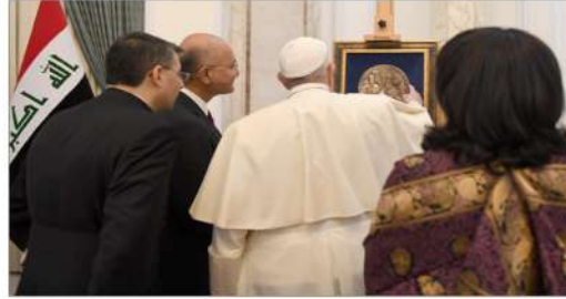
بغداد: الرسالة السياسية