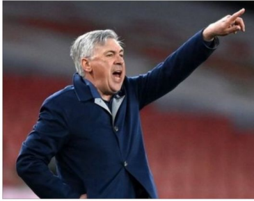
متابع الرسالة السياسية

أبدى الإيطالي كارلو أنشيلوتي، المدير الفني لريال مدريد، استياءه من التعادل السلبي، خلال مواجهة ريال فالينكانو، مساء الأحد، ضمن منافسات الجولة ١٢ من الليجا، في ملعب الميرينجي "سانتياجو بيرناويو". وقال أنشيلوتي، خلال تصريحات نقلتها صحيفة "موندوبورتو" الإسبانية: "أنا سعيد بخروجنا من فخس الطيب، وأتمنى أن نتواجد معنا يوم الأربعاء بديوري البطل (أمام سبورتنج سراجا)، وأنامل ألا تكون الإصابة خطيرة". وأضاف: "لقد لعبنا بشكل جيد، لكننا أنفقنا في تسجيل الأهداف، ونحن متآمرون من النتيجة، وفي الكلاسيكو فرنا في المضايق الأخيرة، وكان من الممكن أن نتعادل، لكنني أفضل الفوز على برشلونة والتعادل مع ريال فالينكانو". وتابع: "أنا سعيد أننا الكثر من الفرص وبالتحديد لفالفيردي، وفي فينيسيوس لكن لم نتمكن من تسجيل". وعن تغيير موريتش، قال: "لقد لعبنا بشكل جيد، لكننا أنفقنا في تسجيل الأهداف، وكان من الممكن أن نتعادل، لكنني أفضل الفوز على برشلونة والتعادل مع ريال فالينكانو". وأضاف: "نحن متآمرون من النتيجة من النتيجة من المباراة، حيث كنا نتسحق الفوز، وفي الترتيب نحن في مركز جيد وكذلك دوري الأبطال، ولدينا الثقة بالفريق، وتسير الأمور على ما يرام". وعن عدم ظهور أريلا جوار، قال: "لم يكن الوقت المناسب للمشاركة، نظرا للاحتياطات القوية والوقت الهبة، لكنه سيعلم قريباً". ويحتل ريال مدريد وصافة جدول ترتيب الليجا برصيد ٢٩ نقطة، بينما ريال فالينكانو في المركز التاسع برصيد ١٨ نقطة. وأهدر ريال مدريد فرصة استعادة الصدارة، حيث يتفرد بيه جوارا برصيد ٣١ نقطة.