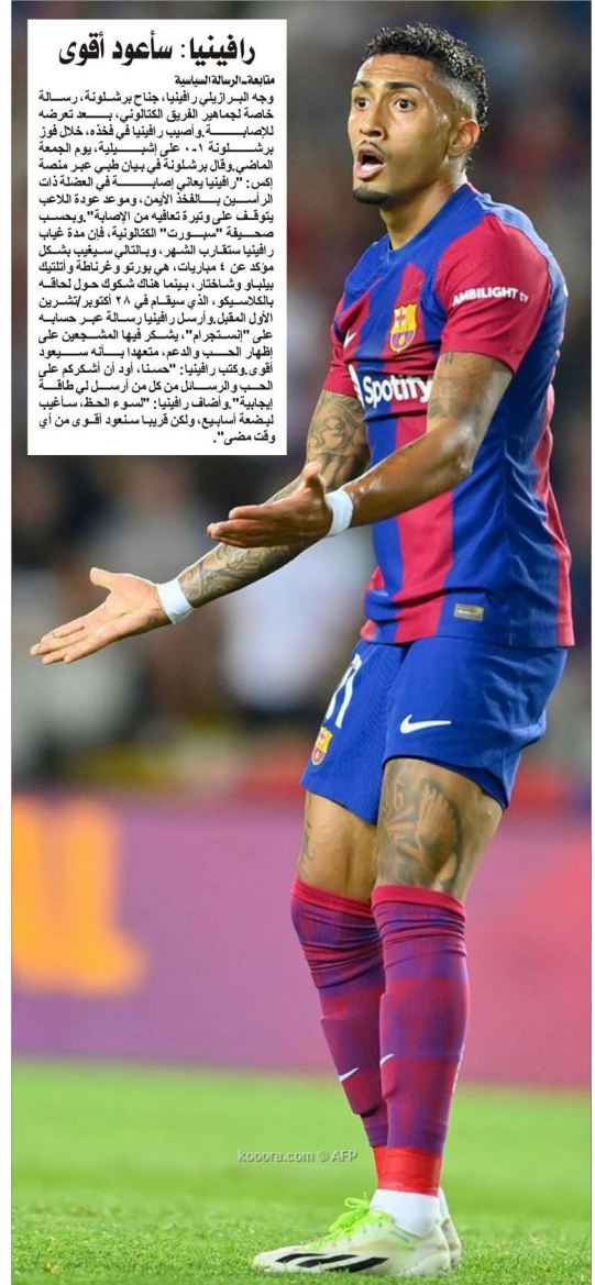
Kouora.com © AFP