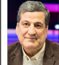
نجاح مجمل علي

وسط الانتعاشات الأخيرة بين القوات التي يقودها الأكراد والقوات العربية، فضلا عن الاحتجاجات المناهضة للحكومة في سوريا، يظل إيران صامدة على تحسوها غير مهوود، لكن بعض وسائل الإعلام الإيرانية تصدعت عودت "الأزمة" في سوريا، التي شهدت لتتو قبول حكومة دمشق في العراق الكويت العربية بعد أكثر من عقد من الحرب الأهلية. وإذا استمرت الأوضاع، فمن غير المرجح ان تظل إيران صامدة. لقد استمرت طهران في مكافحة في ابقاء الرئيس بشار الأسد في السلطة وتطاع على حتى جدي في إعادة بناء البلد الذي مزقته الحرب المدعومة من حشد دولي إقليمي كبير. نعم، كانت الأسابيع القليلة الماضية مثقلة بظلال خاضع في اجراء مختلفة من سوريا. استمرت الانتعاشات التي اندلعت منذ ٢٤ أغسطس الماضي بين الجيش الموحد العسكري السوري العربية وقوات سوريا الديمقراطية قسد التي يقودها المدعومة من دول الخليج المتحدة. والدعت أعمال العنف بين حشد دولي إقليمي كبير. قائد مجلس دير الزور العسكري وأحد قادة مشارة في سوريا، ودير الزور الحسنة في مشارة شرق سوريا. ويشكل ملف سوريا المتعددة الأطراف المتعددة المناهضة للحكومة بسبب الصعود الاقتصادي منذ منتصف أغسطس إلى في المنطق السورية منذ منتصف أغسطس إلى بشار الأسد. وامتدت إيران، الذي يدعو للرئيس الأسد،