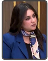
مرونة الوادي بأصالة اجتماعية