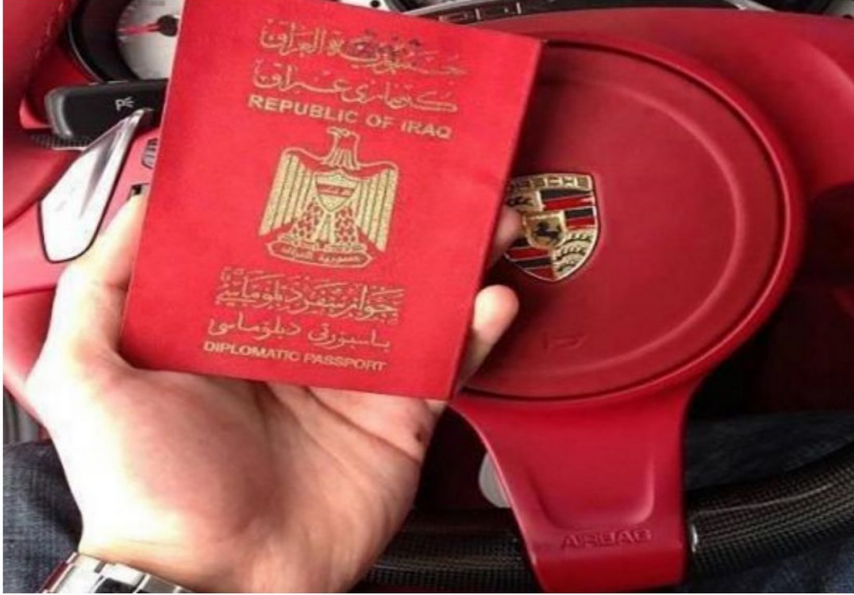
دبلوماسي، ولم ولن أطلب به، لكن هناك موديلز (عارضات) وبنات مشهورات على التيك توك قسي العراق لديهم جواز دبلوماسي، ما هذا؟؟ الجواز الدبلوماسي العراقي لم يعد يسوه (لم تعد له أهمية) في الدول الغربية لأن يقولوا كلهم عندهم جواز دبلوماسي، وحوال كيفية تصليهم على الجواز، قسالت عبر العلاقات، ويتباهون فلان صديقى فلان يسولى (يعمله) جيبى ون". ومنصف