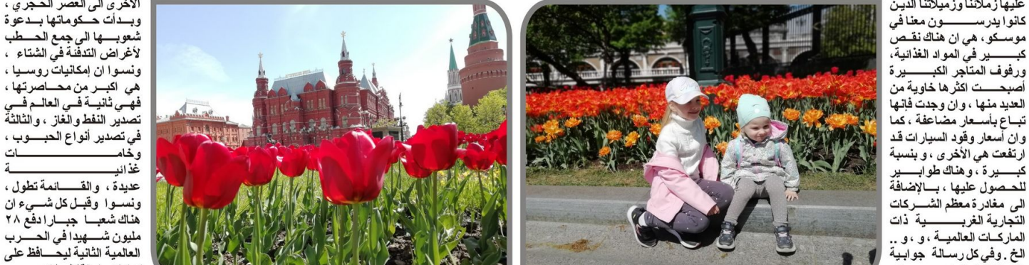
كرامته واستقلال بلاده.

المركز التجاري الذي زاره رئيس التحرير التنفيذي لتلك الأسعار الموجودة في المركز التجاري في الدول الغربية الآن، فإنها لا تشكل الانسبة ه بالمنة فقط، اما محطات تعبئة الوقود، فإنها على عكس ما يشاع عنها، ليس هناك أي ارتفاع لأسعار البنزين بدرجاته المختلفة، على عكس ما يشاع عنها، ولكن وبعد تنظيم بطولته كاس العالم ٢٠١٨، والمشاريع العمرانية التي شهدها موسكو، وتوسيع شبكات محطات قطارات الأنفاق المترو من (١٢٠) إلى (١٥٠) محطة، لتصل إلى معظم مناطق العاصمة وضواحيها، كل هذا دفع الناس إلى ركن سياراتهم عند محطات المترو، والذهاب إلى مركز المدينة والعودة بها، لأنهم أكثر اقتصادا، كون سعر