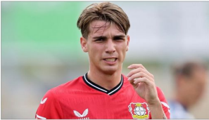
متابع الرسالة السياسية