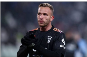
متابع الرسالة السياسية

كشفت تقارير صحفية إيطالية عن آخر التطورات بشأن مستقبل ثنائي يوفنتوس، أرثر ميلو، ويوستون مكني، ودينيس زكريا. وتربط الثلاثي بايرلجن عن يوفنتوس هذا الصيف، بعد خروجهم من حسابات المدرب ماركس جرجي، ويوسيفه "جازايتا ديبلو سيورت" الإيطالي، فقد تشق أرثر عرضين جديدين من إيفرتون وسيورتنج لثبوتة لضمه على سبيل الإعارة، بالإضافة إلى وجود اهتمام من قبل ليون الذي يرغب في تعويض رحيل لويس باكيئا. كما سألوا مسؤولي يوفنتوس عن إمكانية إعارة أرثر في صيفه المقبل. وأضاف الصحفيون مع بداية الاعتلاء على أعارة للاعب، خاصة وأن هناك صعوبة في بيعه بشكل نهائي نظراً لاصوبته ترقية قديمة في وقت سابق على سبيل الإعارة، بالإضافة إلى وجود اهتمام من قبل ليون الذي يرغب في تعويض رحيل لويس باكيئا. كما سألوا مسؤولي يوفنتوس عن إمكانية إعارة أرثر في صيفه المقبل. وأضاف الصحفيون مع بداية الاعتلاء على أعارة للاعب، خاصة وأن هناك صعوبة في بيعه بشكل نهائي نظراً لاصوبته ترقية قديمة في وقت سابق على سبيل الإعارة، بالإضافة إلى وجود اهتمام من قبل ليون الذي يرغب في تعويض رحيل لويس باكيئا.