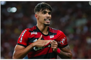
متابع الرسالة السياسية

أعلن وست هام الإنجليزي رسمياً تعاقد مع البرازيلي لويس باكيئا، قداماً من أومبيك ليون الفرنسي. وأصدر وست هام، بياناً عبر حسابه على "تويتر"، كشف خلاله عن توقيع باكيئا لمدة ٥ مواسم، مع خيار التجديد لموسم سادس. وكشف فابريزيو رومانو، المدير الرياضي للنادي، عن قيمة الصفقة، والتي بلغت ٦٠ مليون يورو. وأوضح رومانو، عبر حسابه على "تويتر"، أن وست هام دفع رسوم الانتقال لـ ٤٣ مليون يورو، بالإضافة إلى ١٧ مليون في صورة مكافآت جدير بالذکر، إن اسم باكيئا ارتبط أو لا بالانتقال لأسرنا، قبل أن يتدخل وست هام لخطف اللاعب.