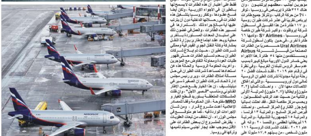
رسل كريم المظفر، موسكو