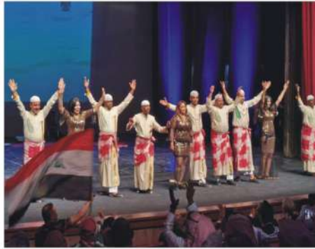
مهرجان شباب والرياضة يختتم فعاليات مهرجان «مسرح الشارع» في سوح الثقافة العربية المعطاءة