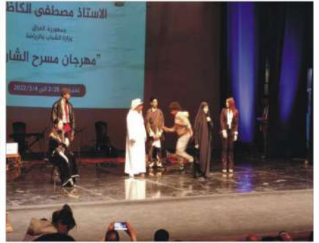
مهرجان شباب والرياضة يختتم فعاليات مهرجان «مسرح الشارع» في سوح الثقافة العربية المعطاءة