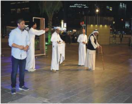
مهرجان شباب والرياضة يختتم فعاليات مهرجان «مسرح الشارع» في سوح الثقافة العربية المعطاءة