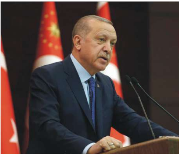
من جانب... والبرهان... والاتفاق...