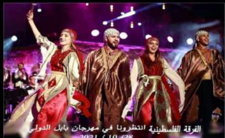
الفرقة الفلسطينية انفتحت في مهرجان بابل الدولي 2021 / 10 / 28