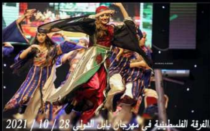
الفرقة الفلسطينية في مهرجان بابل الدولي 2021 / 10 / 28