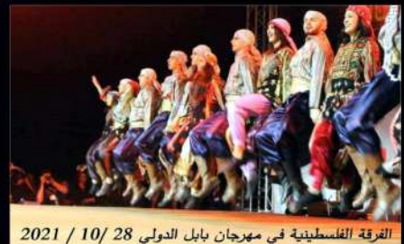
الفرقة الفلسطينية في مهرجان بابل الدولي 2021 / 10 / 28

٢٠ عاما وسيكون العراقي من أبرز المطربين العراقيين المشاركين، التي جابت رحمة رياض التي تستغف على نفس الخشبة التي احياها عبرها والدها الفنان الراحل رياض احمد حفلاته الفنية واخرها كان في عام ١٩٩٧ ولم تصرح حتى الان ادارة مهرجان بابل الدولي باسماء نجوم المشاركين، لكنهم يدعون بشكل كبير من الحفلات الفنية الرئيسية لتتقدم من كل النساء الوطن العربي، يذكر ان مهرجان بابل الدولي بدأ دورته الاولى في عام ١٩٨٧، وموقعه في مدينة بابل الابرية وسط العراق.