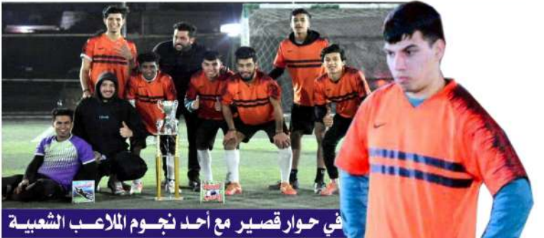
في حوار قصير مع أحد نجوم الملاعب الشعبية

الرسالة السبائية: وكالات يسمى إنتر ميلان للتعاقد مع مهاجم جديد خلال الميركاتو الصيفي المقبل، وسيأتي على طلب المدرب أنطونيو كونتي. ويسبق ان طلب كونتي التعاقد مع مهاجم جديد للتعبئة مع مهاجمين للتحقق من رومولو لوكاتو، لكن اعادة إنتر فست في التمسك رغبته خلال الموسم الحالي، ويسبب معاداة النادي ماينا وفقا لصحيفة "الاصح" البريطانية. فان إنتر ميلان يريد فاسب موفس كل من سيرجيو أجويرو ونجم مانشستر سيتي، ودينيسون كافاني مهاجم الشياطين الحمر وينتهي عقد أجويرو في الصيف المقبل، ويربسه العديد من التكتايرر للانتقال الى برشلونة و باريس سان جيرمان ويصبح كافاني أيضا حرا في الصيف المقبل، حيث يبحث عن مهاجم مع مستوى عال في الصيف المقبل، ولا يرغب المهاجم الأروجوياني في تغلبل بند التعاقد لمدة ١٢ شهرا.