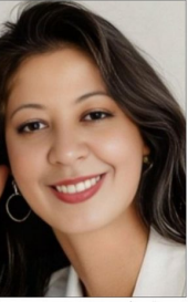
قصيدة / من فتحي حامد - مصر

يا زهرة فوق النيل أضاعت شموع الهوى والقدائل سايحة من هنا وهناك عاشقة للرواية والاساطير بداية من اميرة التوتج حتى شهرة از وجولييت تساليين متقلبات من اطل منصبة مع ام كلثوم كي تشعرت بلذة الغرام لحمت اغنياتها طول الليل لحمت كوكب الشرق عشقك اليها مست جيبني باناملها هست بنشارة احساسها بعيد عنك وامل حياتي والاطلال مدعت مقلتي وكان بلحني من بعد ابراهيم ناجي فكرت مشاعرهما تجاه بكاني وامعي تزايد اغنياتهم بالنون من احاسيس فماستني الرقيقة لماما تعجبت واندهت من سوالها المست كتابا مقروءا امام عينيها اشفى علاقة للحياة والمودة للمشاعر هادية ميتي كسوف فوق سحب تخلو من شهب حارقة جيراني من طيور النورس الصافية تلاحق جيايبي وتكتر نيايبي ياطول موسمية متتعة بداية من اسول ربيعية حتى اوام خريفية مفجور ذيلسحر والشعودة لاقلدة مائة مقلنة شموس علق ورغبة تجاه مشاعر متالفة صراخ يعلو اوراق الخريف ينادي عودة الروح بعد الغياب تنادي الحبيب لاحضان فداء وسعادة راجية عودة الغرام والاشتياق بين رجل وامراة يا هو تامل كوني ايستد لي كوكب الشرق ثم توجني اكليل النجل من نظرات ابراهيم ناجي اجبتها التي نجمه خلقت من بريق مقلتي من هواه عشق الدنيا والى جنته القسية والعبادة